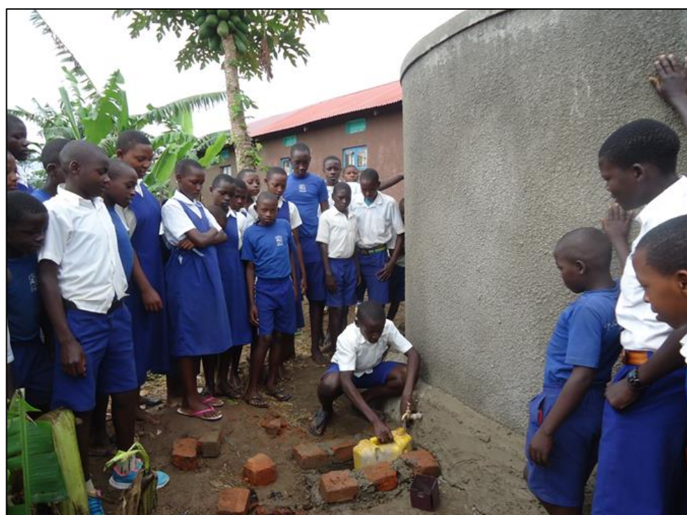
3. Uno studente prende l'acqua dalla cisterna

La scuola è frequentata da 587 bambini e ha 16 insegnanti. A tutti loro è stata data la possibilità di avere acqua pulita e di facile accesso.